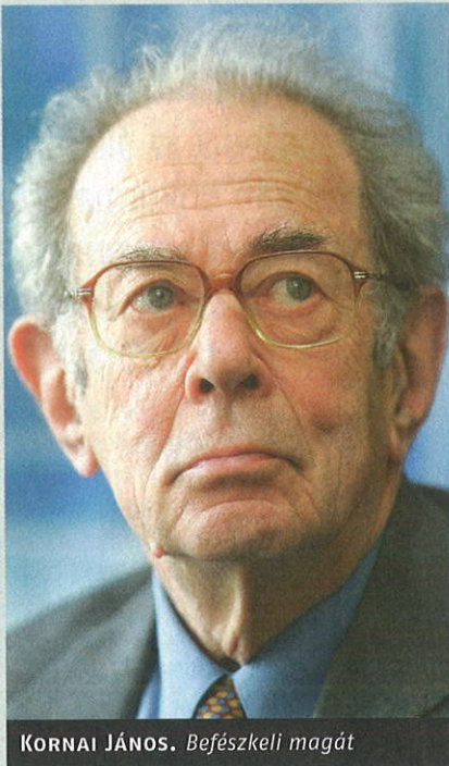
KORNAI JÁNOS. Befészkel magát

befészkel magát a gazdaság szereplőinek tudatába, kevesebb erőfeszítést tesznek a nyereség növelésére, a költségek csökkentésére, romlik a hatékonyság, lankad az innovációs kedv. A vezetők inkább a lehetséges támogatókra figyelnek, a járulékhajhászásra koncentrálnak, nem a piacra. A gazdaságban tompul az árérzékenység, a szereplők nem az árjelzések alapján döntenek. Ha egy gazdaságban fizetés nélkül is lehet vásárolni, hiszen az állam utólag állja a cseht, indokolatlanul megugrik a kereslet, meglódulnak a piaci alapot nélkülöző beuházások.