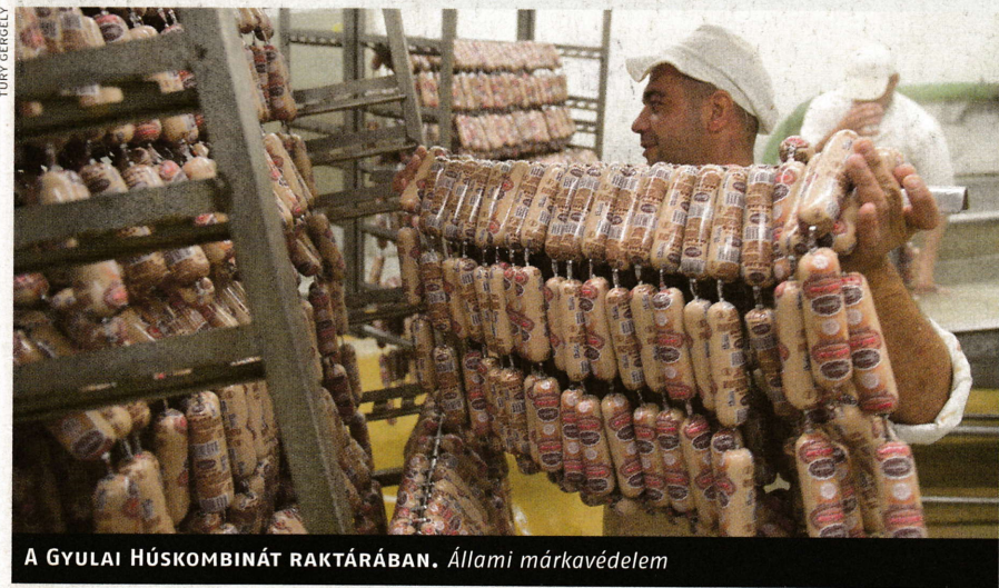
A GYULAI HÚSKOMBINÁT RAKTÁRÁBAN. Állami márkavédelem

jóvoltából a város számláján, és a pénzt az önkormányzat a Gyulahús Kft.-be öntötte. Majd ez a cég 850 millió forintos áron megvásárolta a felszámolás alatt álló Gyulai Húskombinát Zrt. ingatlanait és eszközeit, valamint a gyulai kolbászok és más termékek márkavédjegyeit a felszámoló Nemzeti Reorganizációs Nonprofit Kft.-től. A tavaly januárban alapított Gyulahús Kft. hárommilliárd forint árbevétel mellett szerény, 27 millió forintos nyereséggel zárta az évet.