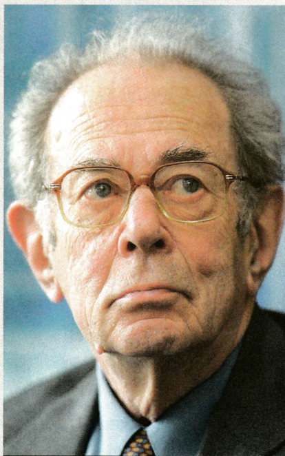
KORNAI JÁNOS. Befészkezi magát

befészkezi magát a gazdaság szereplőinek tudatába, kevesebb erőfeszítést tesznek a nyereség növelésére, a költségek csökkentésére, romlik a hatékonyság, lankad az innovációs kedv. A vezetők inkább a lehetséges támogatóikra figyelnek, a járulékhajzásra koncentrálnak, nem a piacra. A gazdaságban tompul az érzékenység, a szereplők nem az árjelzések alapján döntenek. Ha egy gazdaságban fizetés nélkül is lehet vásárolni, hiszen az állam utólag állja a ceket, indokolatlanul megugrik a kereslet, meglódnak a piaci alapot nélkülöző behúzások.