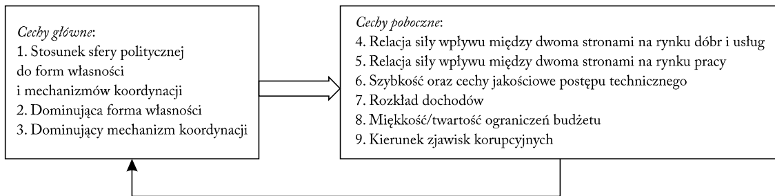
Rycina 1. Powiązania między cechami głównymi i pobocznymi